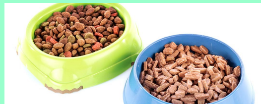
Makanan Haiwan Kesayangan (jenis dry food dan canned food sahaja)