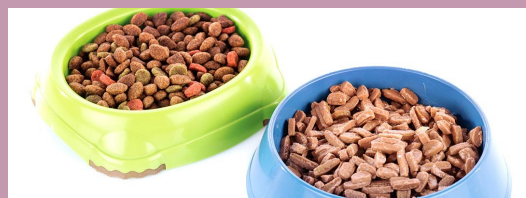
Pet Food (Dried and Processed only)