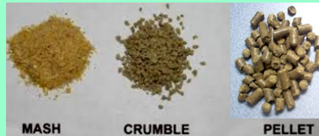
Makanan Ayam / Ternakan Proses (Pellet)