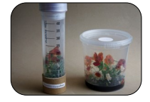
Tisu kultur tumbuhan